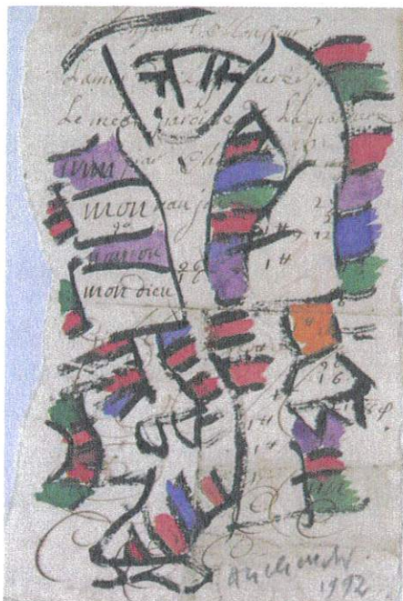
Pierre Alechinsky (1927 -), Sorti de la poche , 1992, encre de Chine et aquarelle sur vergé du XVII e siècle (pièce avec écritures et essais de plume), 19,5 x 13 cm, Paris, centre Georges Pompidou.