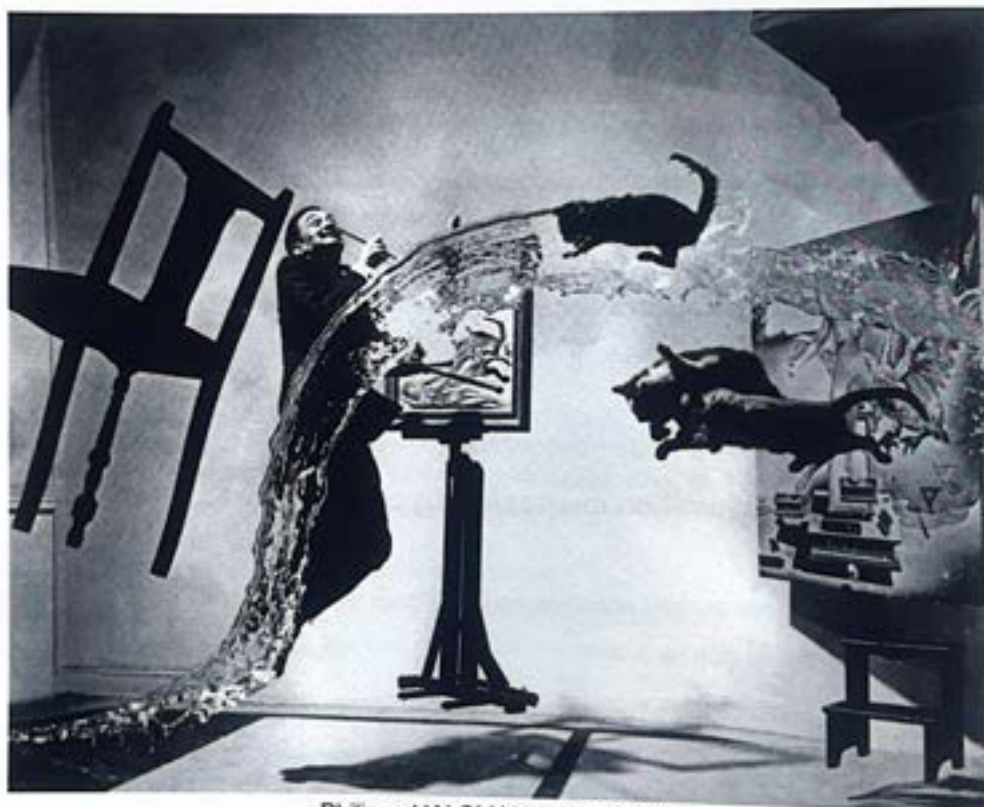
Philippe HALSMAN (1906-1979) Dali atomique Vers 1948 Photographie, tirage gélatine d'argent. New York, Museum of Modern Art.

Au moins une des ressources iconographiques présentées ci-après sera mobilisée dans la conception et/ou le déroulé de la séance.