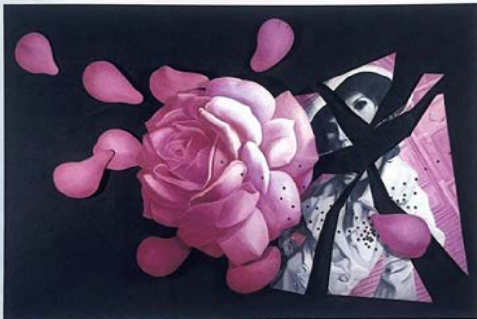
Jacques MONORY La fin de Madame Gardénia 1964/66 Huile marouflée sur toile 280 x 320 cm Pau, Musée des Beaux-Arts